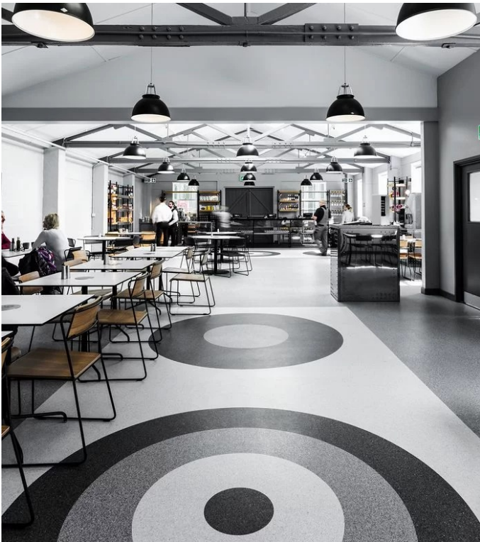
Polyflor Classic Mystique PUR, Polyflor Mystique PUR

These 2.0mm products are use classified at 23, 34, 43 according to ISO 10874.